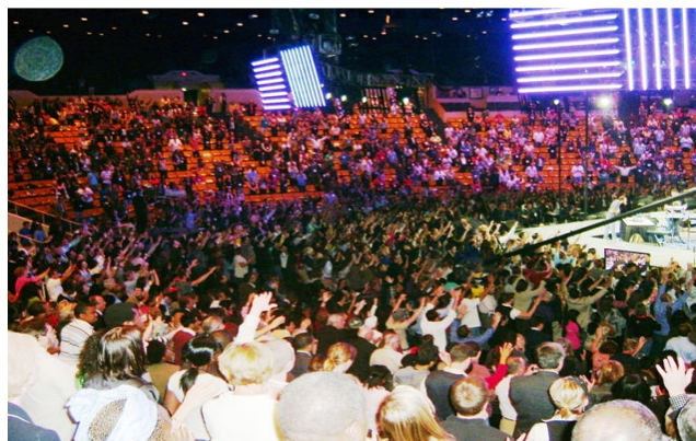
Service d'Impartition « Empowered 21 »- Service à l'Autel-