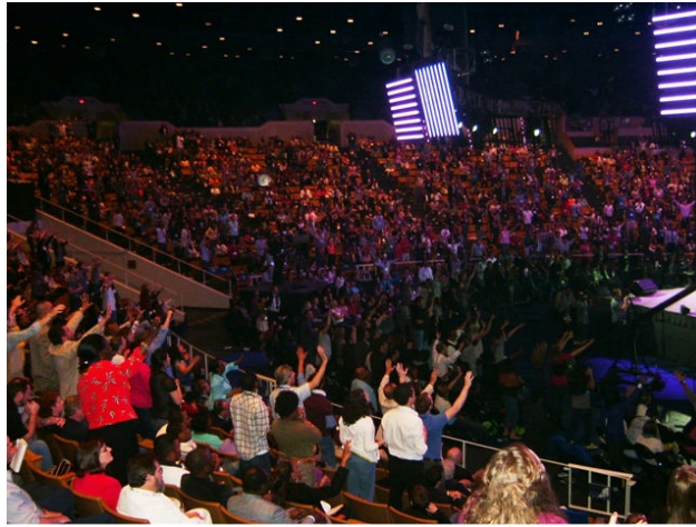
Mabee Centre ORU-« Empowered 21 »