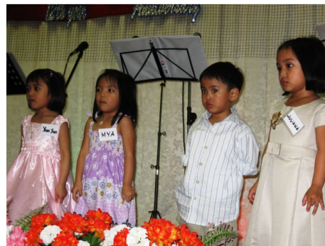
La Chorale des enfants