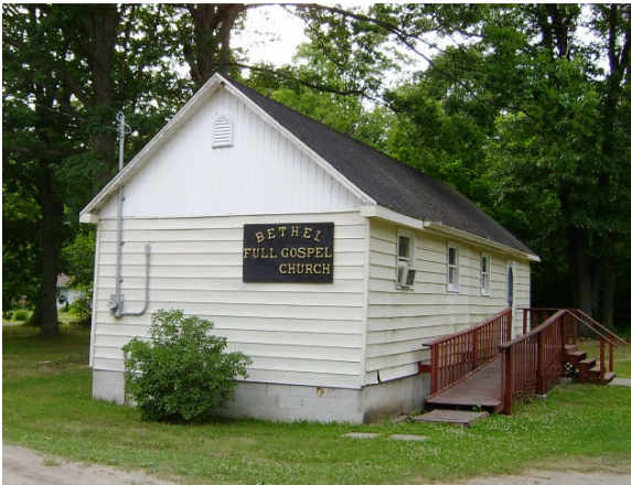
Bethel Full Gospel Centre Moraviantown, Ontario