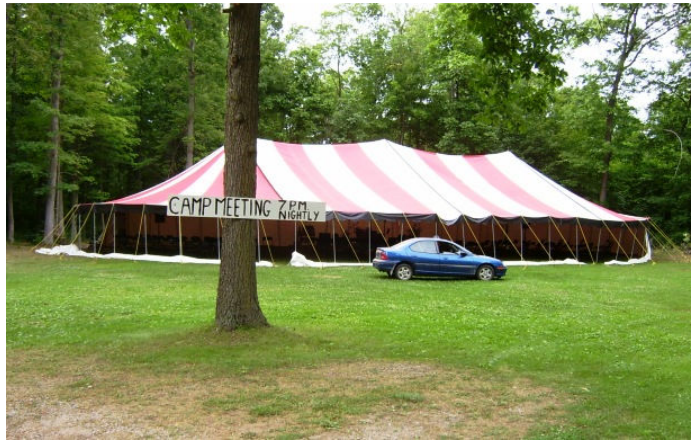
Gospel Tent Campmeeting