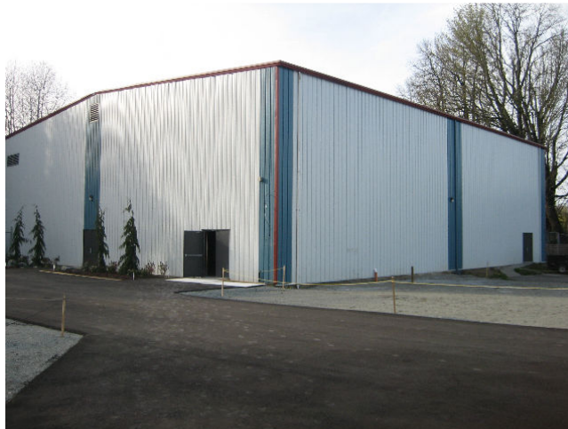
Centre d'Adoration et le Gymnase