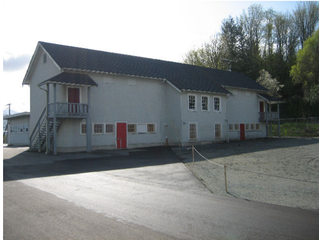
L'école que nous avons achetée