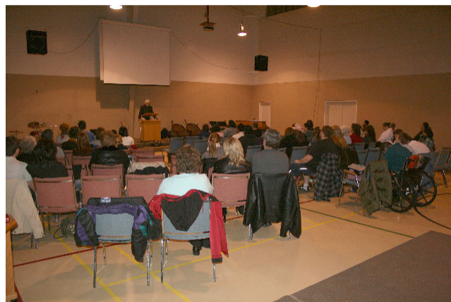
Le Sanctuaire Temporaire